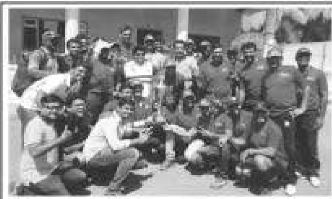
RISERS Cricket Team - First Runner-up YSL 2016