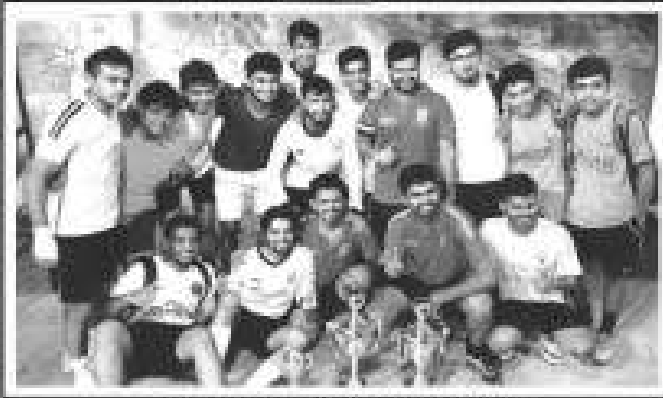
Aarti Cup 2016 Winner Team