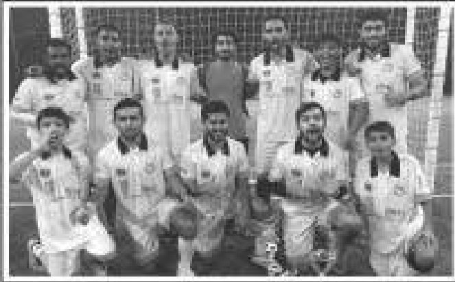
KSL 2016 First Runner-up Team