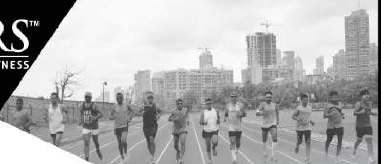
Berlin Marathon 2015