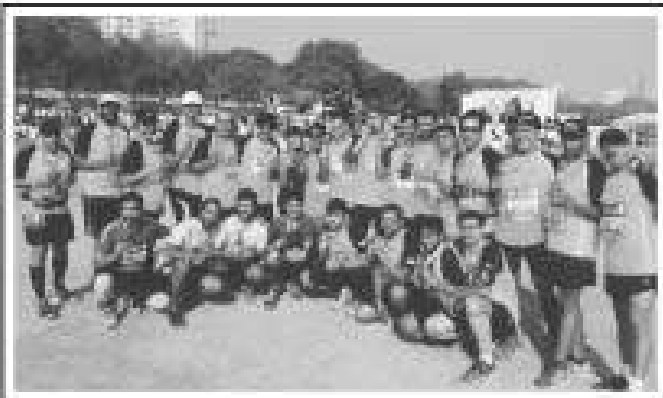
Standard Chartered Mumbai Marathon-2016